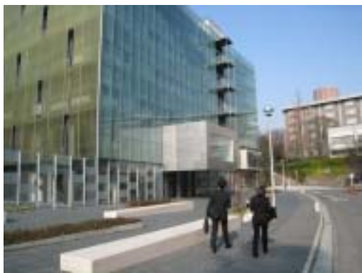
名古屋大学の様子

最後になりましたが、このような非常に有意義な学会に参加させていただける機会を与えてくださったBMCプログラム、また様々な面で支えてくださった皆様に心より感謝の意を表します。